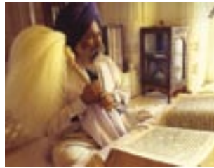
Un Sikh leyendo La Sagrada Escritura Guru Granth Sahib. Un batidor real entre sus manos es majestuosamente oscilado sobre las Escrituras como recordatorio que la revelación de Dios es soberana.

Los Gurús Sikh basaron sus enseñanzas en una revelación categórica de Dios, la cual establece la base del Guru Granth Sahib, la Escritura Sagrada Sikh. El Guru Granth Sahib enseña a través de la poesía divina que esta a un sistema formal de música clásica Sikh. Los himnos del Guru Granth Sahib proporcionan extensos lineamientos para una vida armónica. En la recopilación de la Santa Escritura Sikh, los Gurús incluyeron los himnos de muchos otros guías espirituales de diversas tradiciones religiosas, no pertenecientes a los Sikhs, haciendo que el Guru Granth Sahib sea verdaderamente universal.