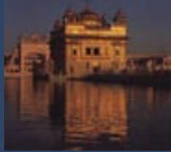
Darbar Sahib, también conocido como el Templo Dorado, se encuentra localizado en Amritsar, Punjab. Es la capital Teológica y Política de los Sikhs.